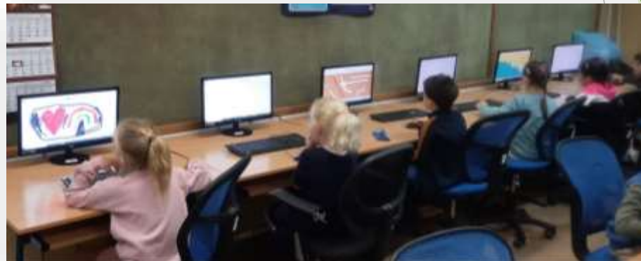
„Informatyka dla Smyka”